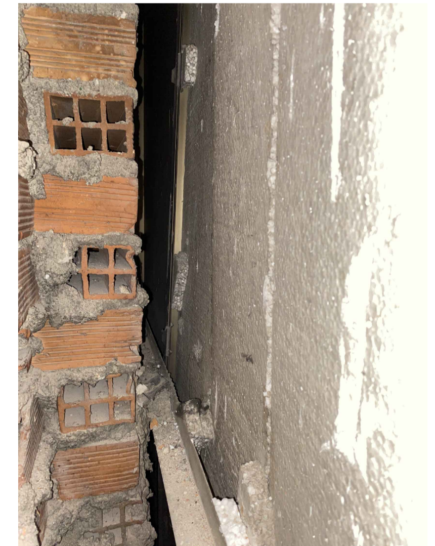
Cata andaje revestimiento fachada en planta 12"