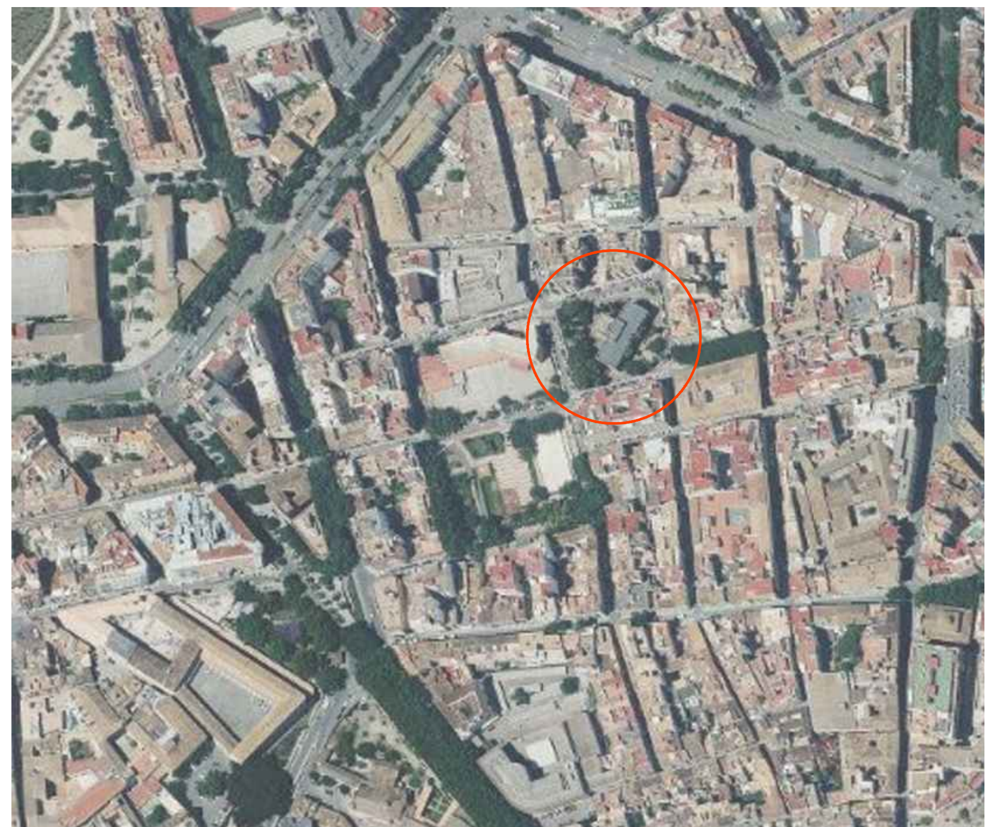
SITUACIÓN (Ortofoto.) E:1/2000