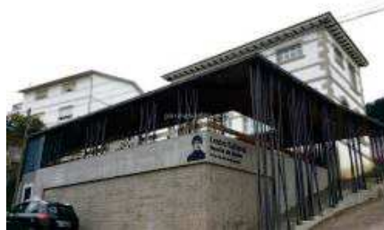
Centro cultural de Domaio

Non existe na parroquia de Meira espazo algún que permita as asociacións con fins culturais desenvolver a súa actividade, sendo preciso dispor dun espazo céntrico e estratéxico que reúna todas as necesidades da parroquia, e mesmo sirva para unificar as características sociais da parroquia de Meira, que permita a toda a veciñanza acercarse de forma accesible ao mesmo e garante a canalización dunha boa comunicación entre os veciños e veciñas de Meira.