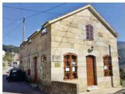
Centro cultural de Verdededo

O concelleiro delegado de Cultura, mediante informe emitido en data 15 de novembro de 2023 (csv: A45DSZFK4A2MQNDLTNYSLX64- https://concellodemoana.sedelectronica.gal/ ) emite informe de alugueiro de inmovible para o Centro Sociocultural de Meira como espazo axeitado onde poidan reunirse as asociacións para poder desenvolver a súa actividade, tal e como dispoñen o resto das parroquias de Moaña: Centro cultural Rosalía de Castro en Domaio, Centro Cultural Daniel Castela en Quintela, Centro Sociocultural X M Castroviejo en Tirán e mesmo o centro Sociocultural Ramón Cabanillas no barrio do Real, Centro cultural de Verdededo: