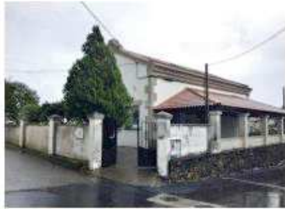
Centro cultural de Tirán