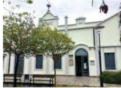
Centro cultural de Quintela