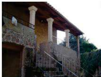
Centro cultural de Abelendo