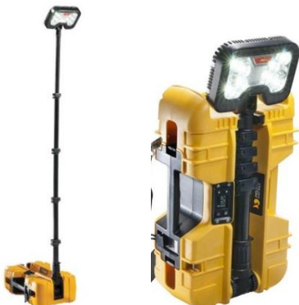
Imagen orientativa del formato: