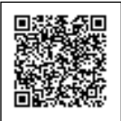
TABOA-03. VALORACIÓN DAS OFERTAS ECONOMICAS DO EXPEDIENTE: 1374_441_calculos_valoración_formulas_def_rev.xlsx