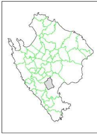
MARRATXÍ EN MALLORCA - ISLAS BALEARES