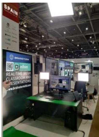
Ejemplo de stand de 15 m 2 edición 2023

El ofertante deberá adjuntar fotografías del mobiliario propuesto.