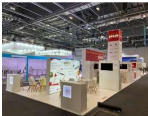
Edición 2022: Imagen orientativa

En los supuestos en los que la normativa ferial imponga restricciones constructivas en los casos de medianerías con otros estands/o cerramientos del recinto ferial (especialmente retranqueos), el Adjudicatario deberá colgar la señalización y elevarla a la máxima altura permitida en cada supuesto.