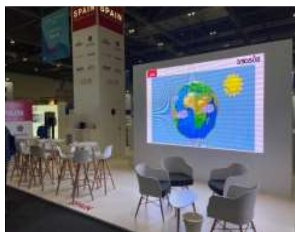
Ejemplo de zona común edición 2023

ICEX se reserva el derecho de hacer pequeñas adaptaciones en el diseño de los puestos de trabajo que no afecten sustancialmente a lo descrito anteriormente, se trata de adaptaciones dimensionales.