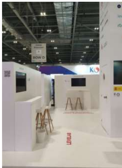
Ejemplo de puestos de trabajo edición 2023