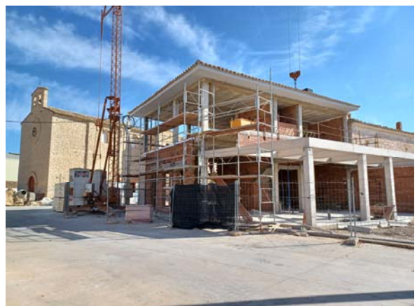
Vista desde C/ Oriente (acceso a patio)