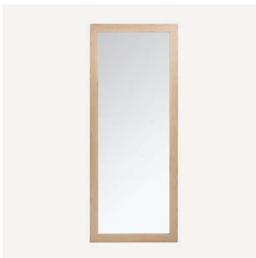
1.2.1 Espejo de suelo Katia – ECI. Color Natural. 700x180x15.