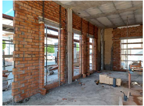
Planta Baja – Zona de Bar

Se aporta, a continuación, plano de situación del Inmueble para Servicios Municipales: