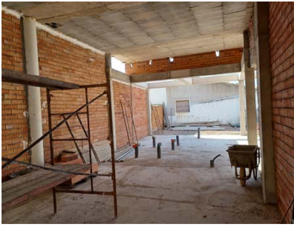
Planta Baja – Zona de Aseos Bar y Cocina