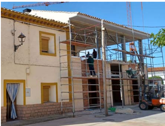
Vista desde Plaza España (acceso peatonal)

Se incluyen, a continuación, fotografías representativas del estado actual de las obras en ejecución: