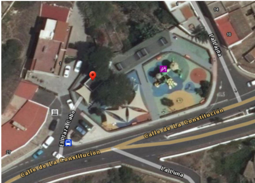
Situación del quiosco. Plaza El Cabo.