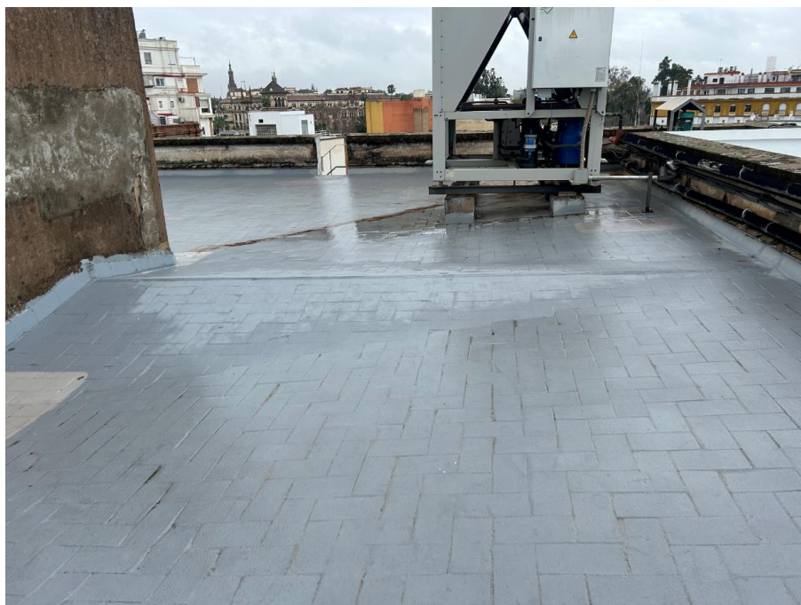
Faldón de cubierta planta segunda esquina calles Temprado y Santander