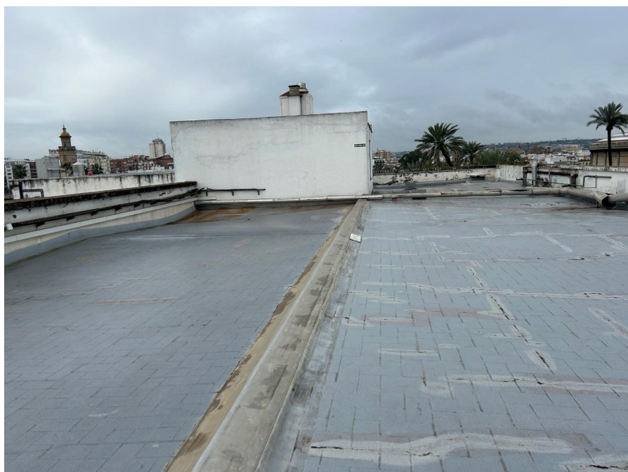
Faldón de cubierta planta tercera junto Patio colindante a Hospital de la Caridad