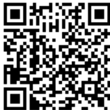
Código QR para validación en sede

Regulación CSV: Decreto 3628/2017 de 20-12-2017