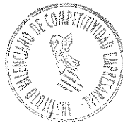
Fdo. Lucía de Pedro Área internacionalización