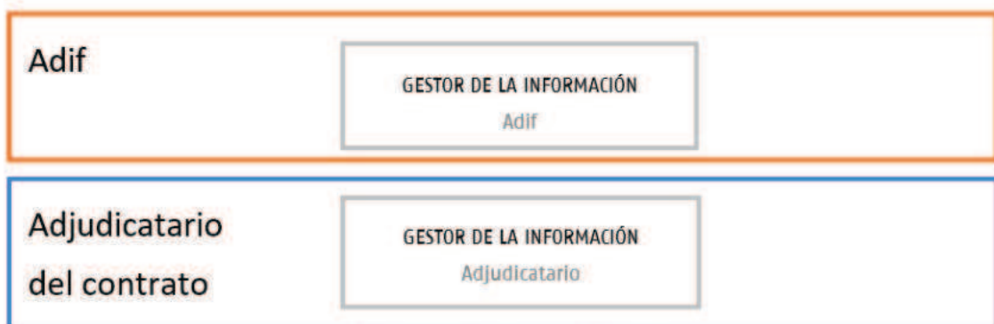
Ilustración 1. Organigrama del contrato.

El organigrama del contrato para la gestión del CDE será similar al siguiente: