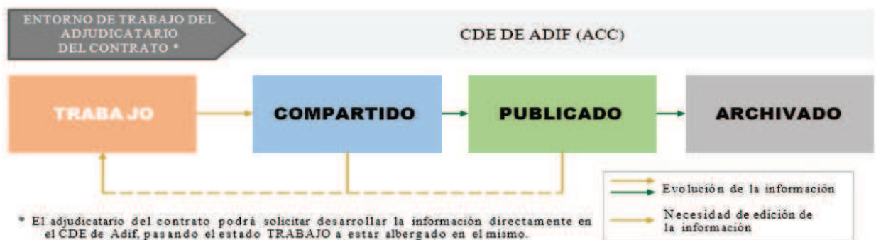
Ilustración 3. Estados de la información.

(La información en estado Archivado se alojará en el CDE de Adif).