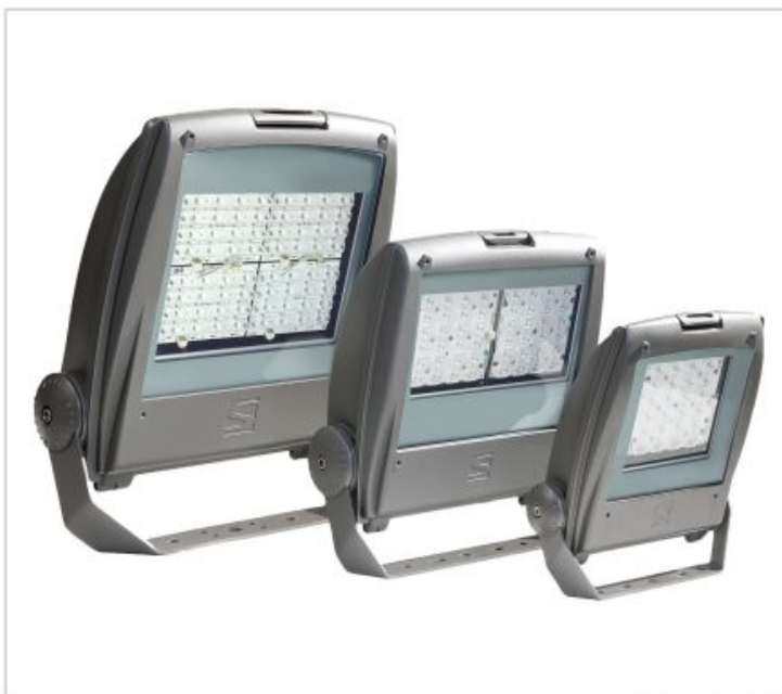
Diseño : Michel Tortel