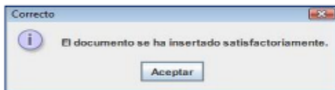
Ilustración: Mensaje de confirmación

Si el licitador sube un documento cuyo formato original no coincide con el que figura en el nombre del archivo, se obtendrá el siguiente mensaje: