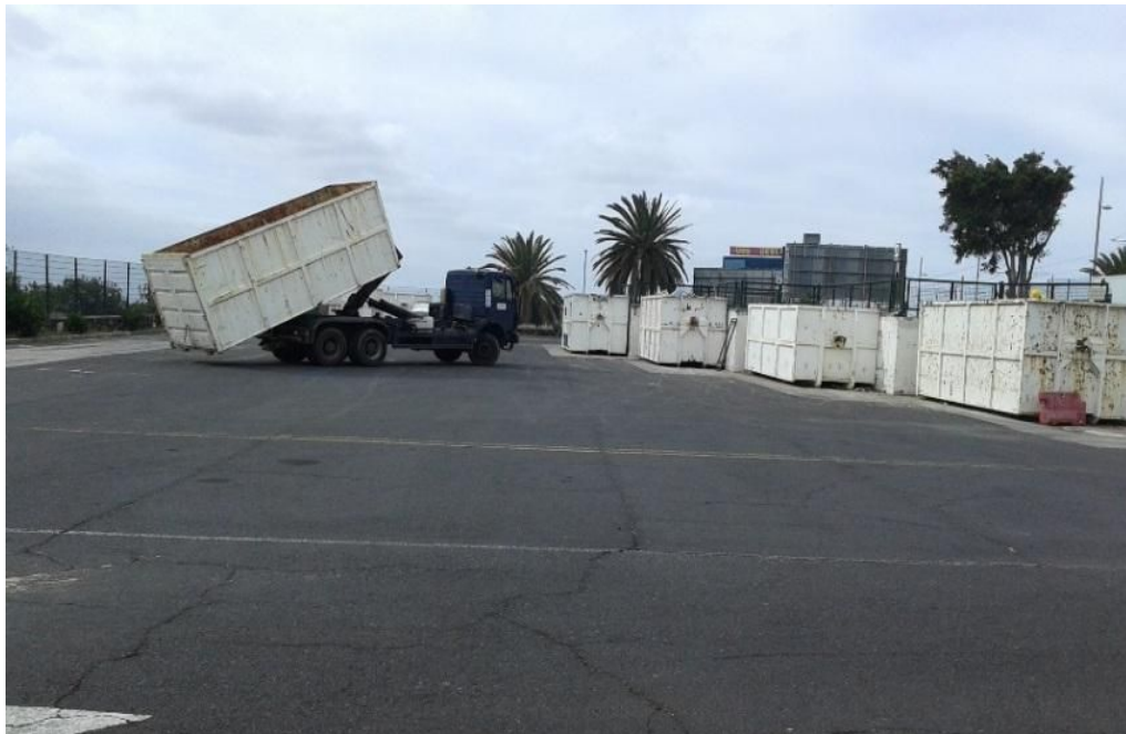
Bandejas abiertas en el punto limpio de Taco

A priori, son susceptibles de ser transportados a través de estas bandejas los siguientes residuos: escombros, muebles y enseres, plásticos (no envases), maderas, restos de poda y jardinería y metales, aunque no se descarta la inclusión de algún otro tipo de residuo en el futuro.