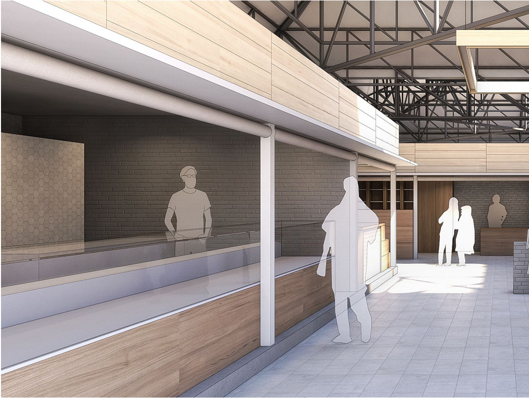
EXEMPLO DE REVESTIMENTO FRONTAL EN MOBLES EXPOSITORES