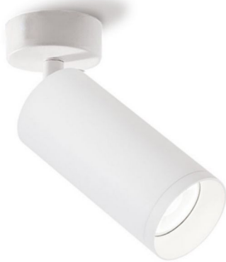
EXEMPLO DE FOCO ORIENTABLE SEMPRE ACABADO BRANCO

De forma adicional, poderán instalarse lámpadas suspendidas sobre os mesados e mostradores frontais, buscando un modelo similar ó proposto, cun diámetro de campá duns 250mm. A cor destas lámpadas será branco mate, a excepción do caso dos postos 07 e 06 , no que a cor permitida será escuro, cercana ó RAL 7016. Este tipo de lámpadas sempre quedarán penduradas dende o teito interior do posto (cartón-xeso) e nunca dende a viseira frontal de aceiro.