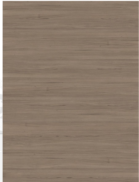
MADEIRA ESCURA (PERMITIDA PARA MOBLES E FRONTAIS)