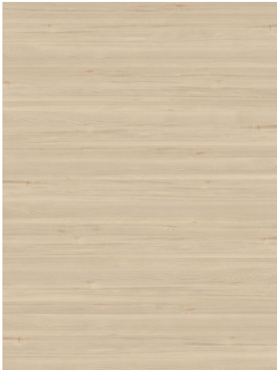
MADEIRA CLARA (PRESENTE EN FRISOS SUPERIORES)