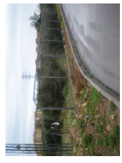
FOTO 4: Separación parcela con Aparcamiento Complejo Deportivo de Son Moix