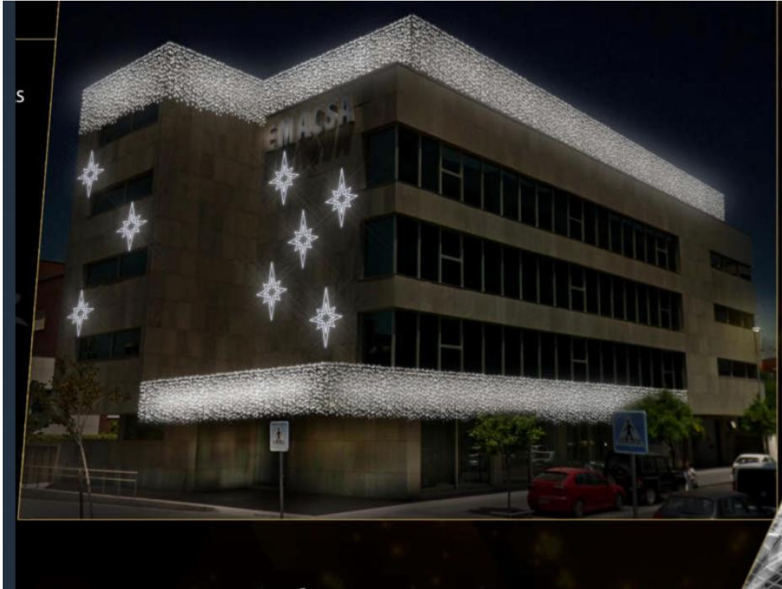
Figura 2: Ejemplo diseño gráfico alumbrado decorativo navideño fachada edificio Oficinas Centrales

Una vez adjudicado el servicio, EMACSA notificará por escrito al adjudicatario, cuál de las propuestas de diseño de alumbrado decorativo navideño presentadas, se instalará en el edificio.