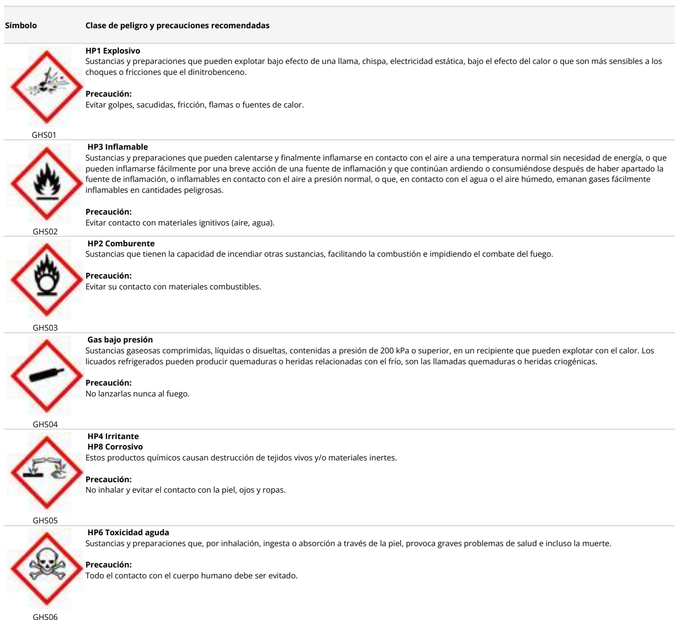
Tabla 10 Pictogramas de peligro para sustancias químicas según el Reglamento (CE) nº 1272/2008