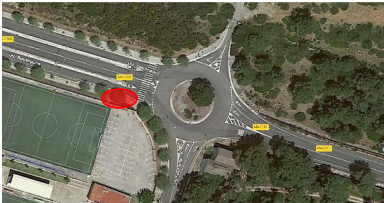
Zona d'ubicació del punt d'atenció 1 als usuaris de la via. Ma-2210, PK 2+000

La ubicació aproximada dels punts d'atenció a l'usuari es reflecteixen al croquis següent: