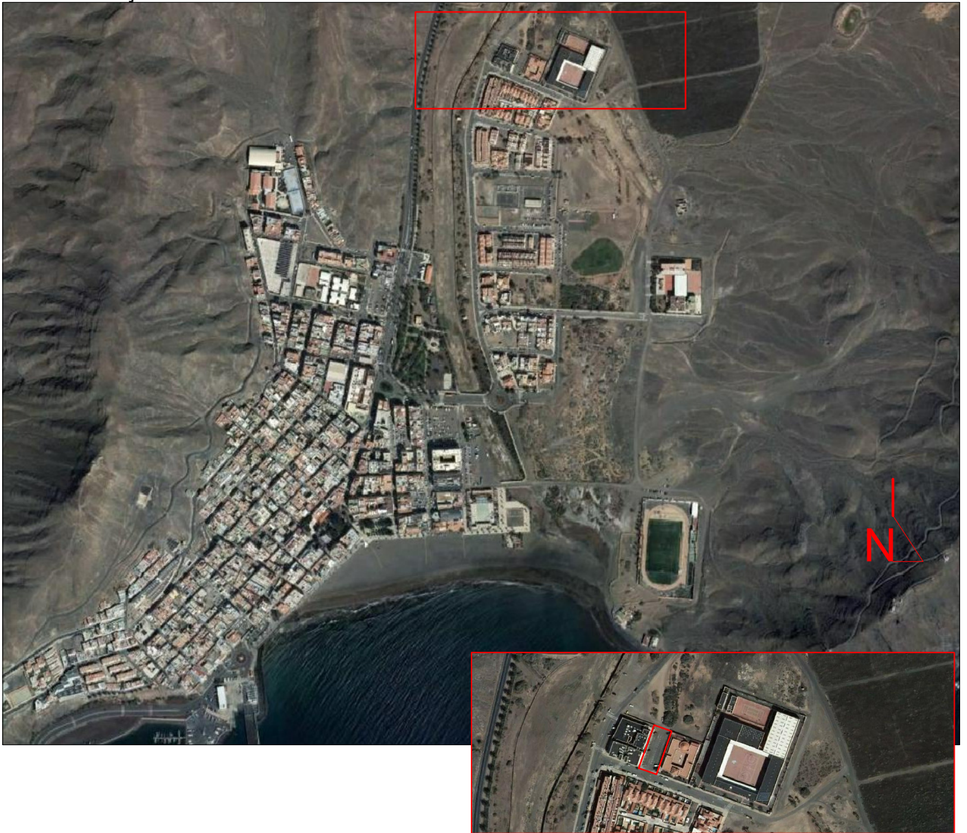
Parcela de estudio geotécnico