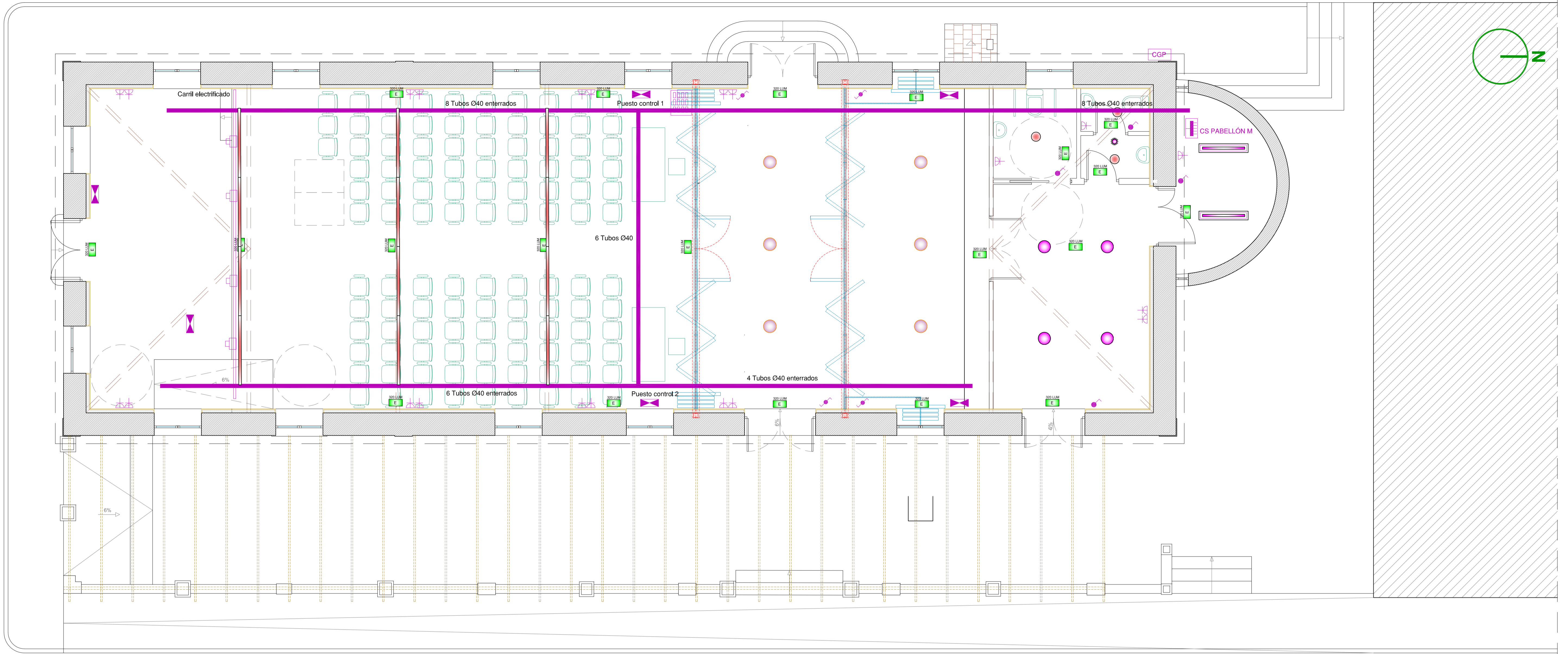
Cuadro General de Mando y Protección SALÓN