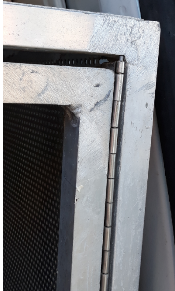
Figura 2. Recubrimiento de chapa de aluminio agujereada.