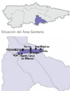
Situación del Área Sanitaria