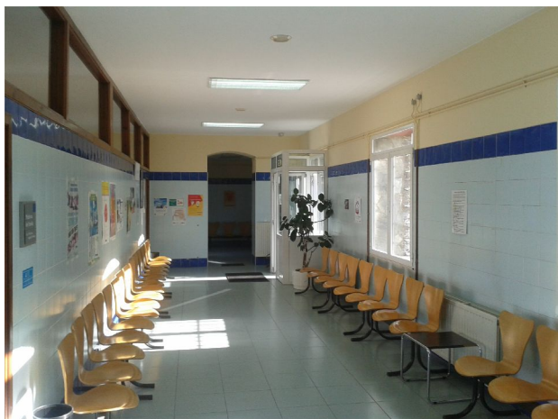
Fotografía General Interior