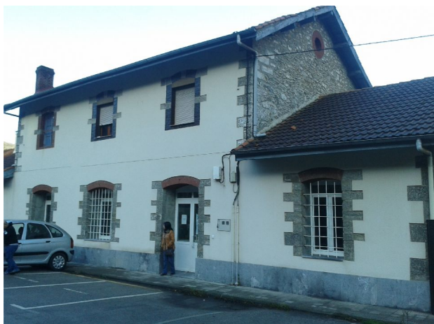
Fotografía General Exterior