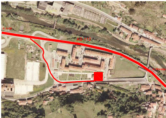
Ortofoto del Núcleo de Población