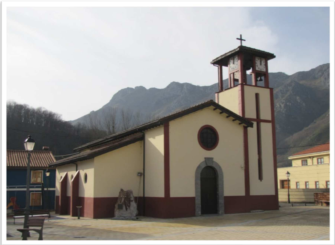
IGLESIA DE SAN ADRES (SOTO DE AGUES)