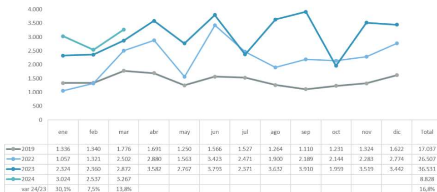
Viajeros norteamericanos entrados en los establecimientos alojativos de Tenerife (hotel + apartamento)