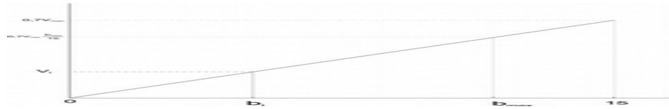
Figura 1: Representación gráfica das puntuacións se b_{max} < 15 .

son todas moi pequenas aínda que non sexan exactamente cero. Por iso, propoñemos dar unha puntuación nula a todas as ofertas sempre que b_{max} \leq 10^{-6} .