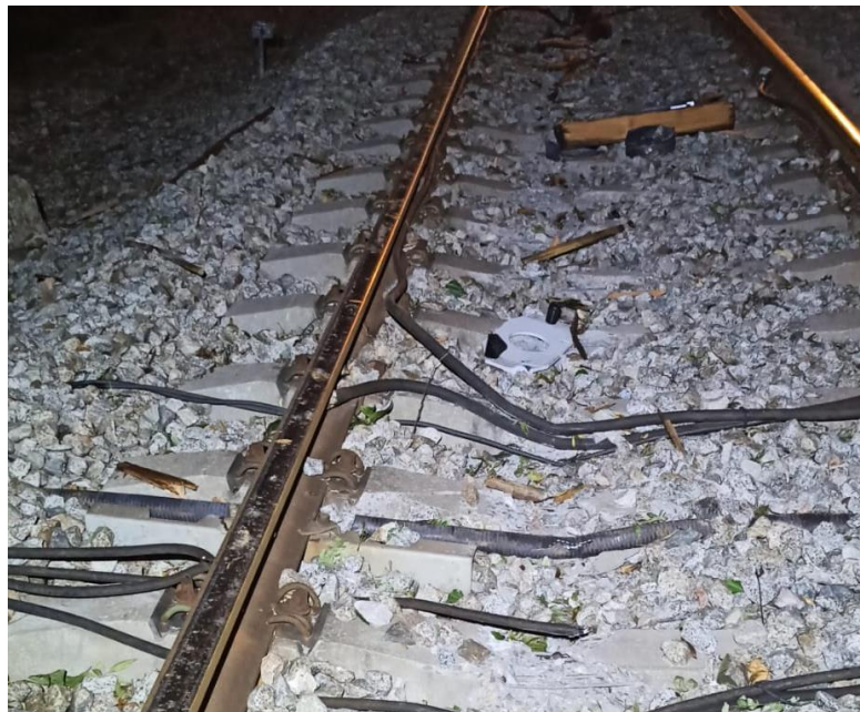
Estado actual del cableado de instalaciones de seguridad