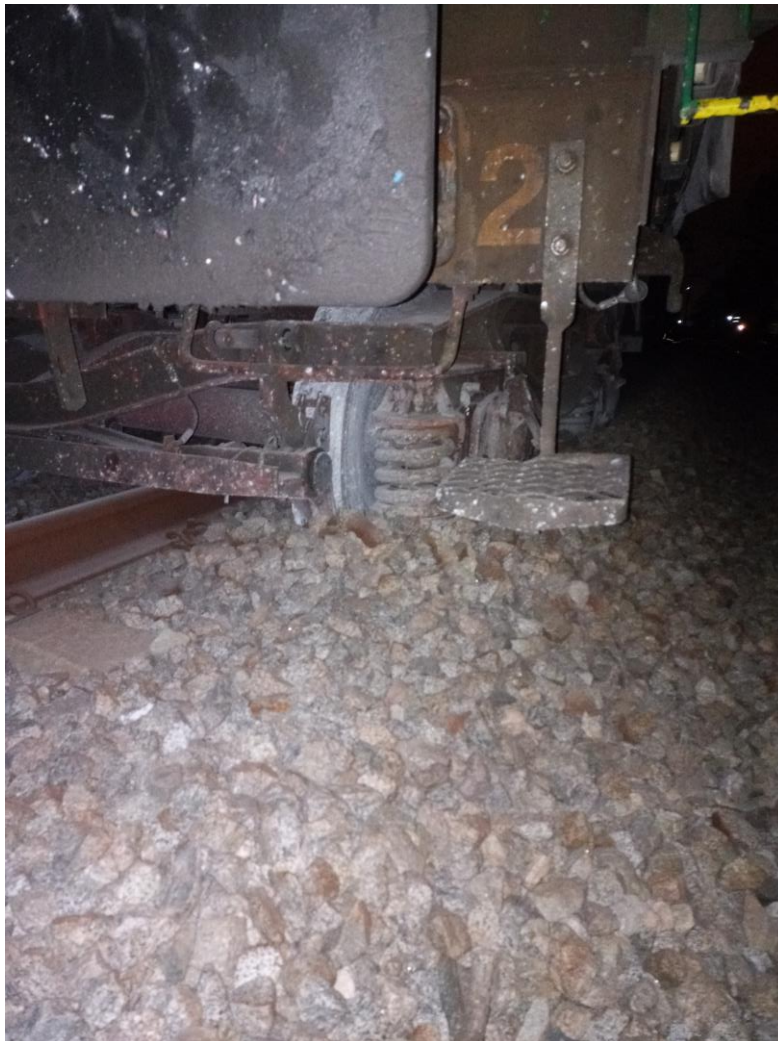
Estado bogie descarrilado

Por todo ello urge el restablecimiento inmediato de la vía par a las condiciones de operatividad y seguridad adecuadas.