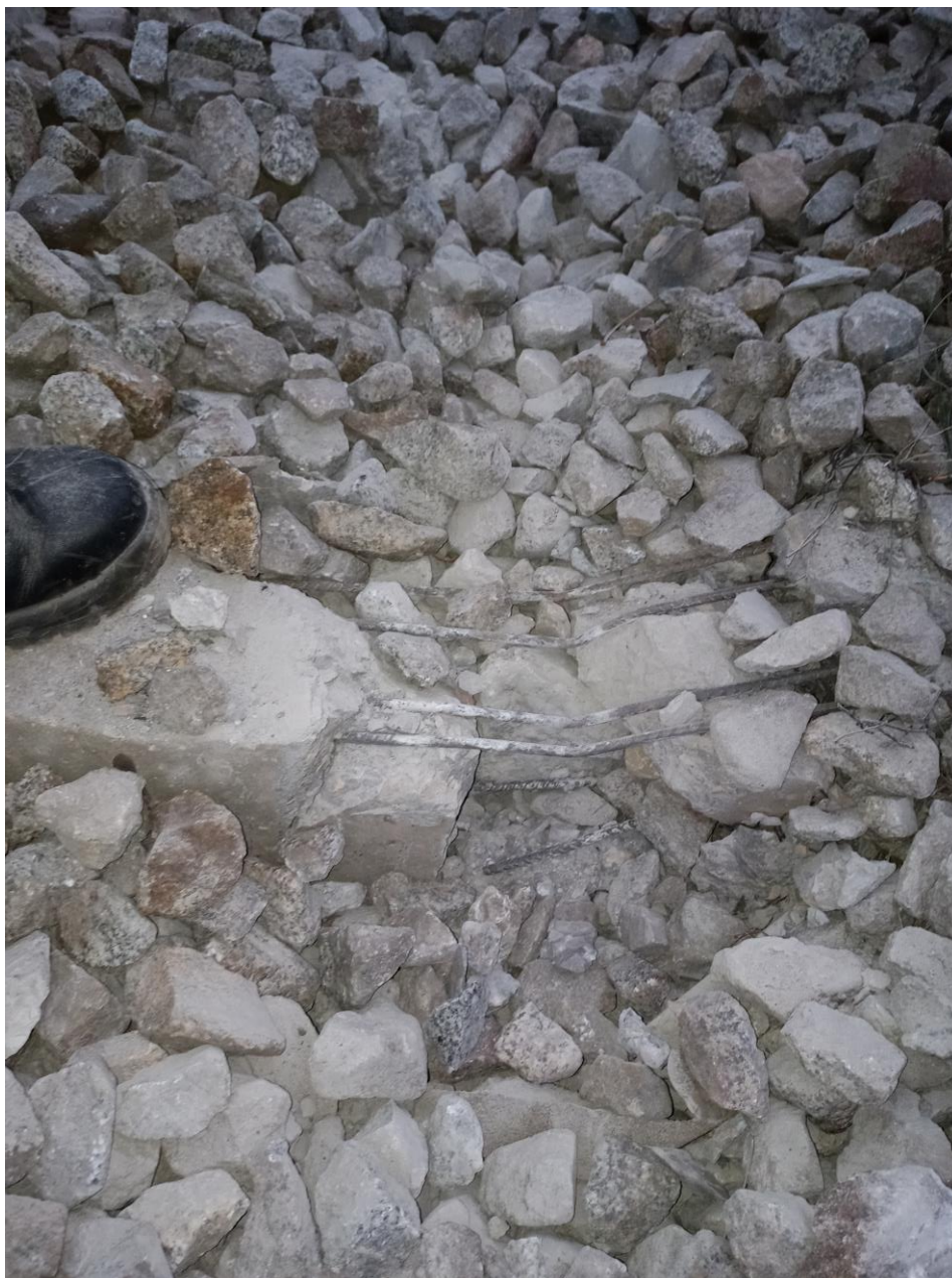
Estado de las traviesas afectadas por el descarrilo