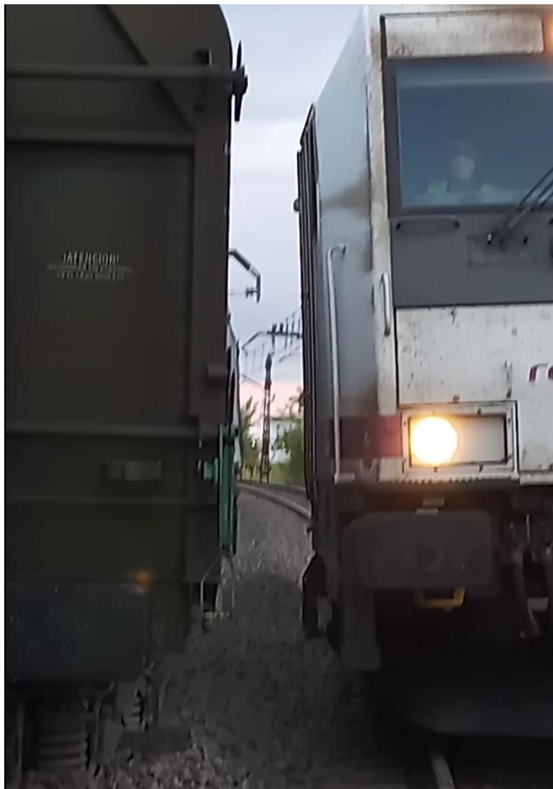
Comprobación de Gálbo