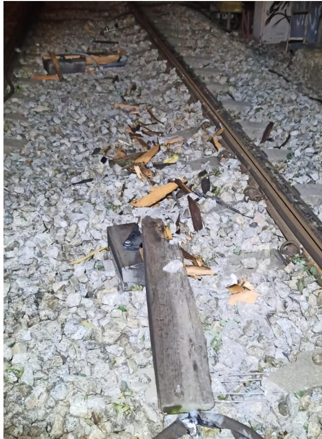
Baliza rota por el paso del tren