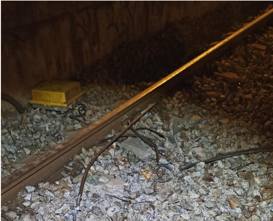
Detalle del cableado cortado de los circuitos de vía