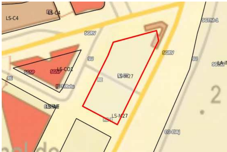
Ubicación de la parcela M-27. Base de datos de planeamiento (BDP de Canarias-GRAFCAN)