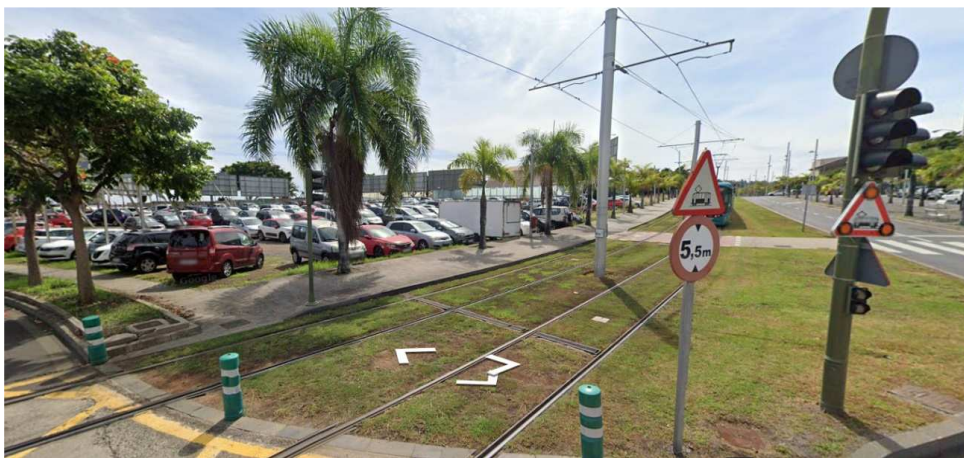
Fotografía de la parcela desde la rotonda de unión entre Av. 3 de Mayo y Av. Víctor Zurita

En la actualidad la parcela se divide en dos, una parte contiene una terraza que estuvo en explotación hasta recientemente, y la otra parte contiene un aparcamiento de tierra.