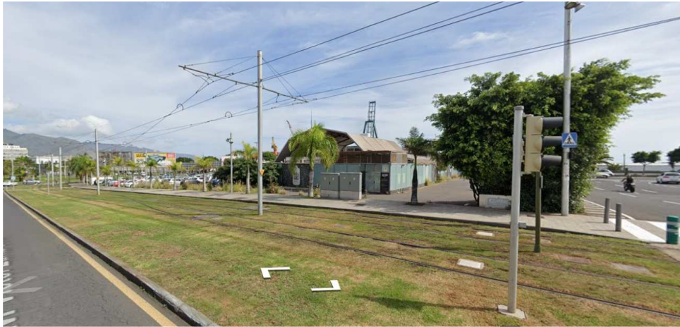
Fotografía de la parcela desde la Av. Víctor Zurita