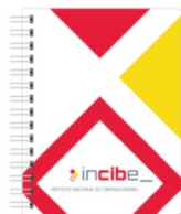
Figura 20. Libreta