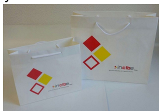
Figura 19. Bolsa de papel mini