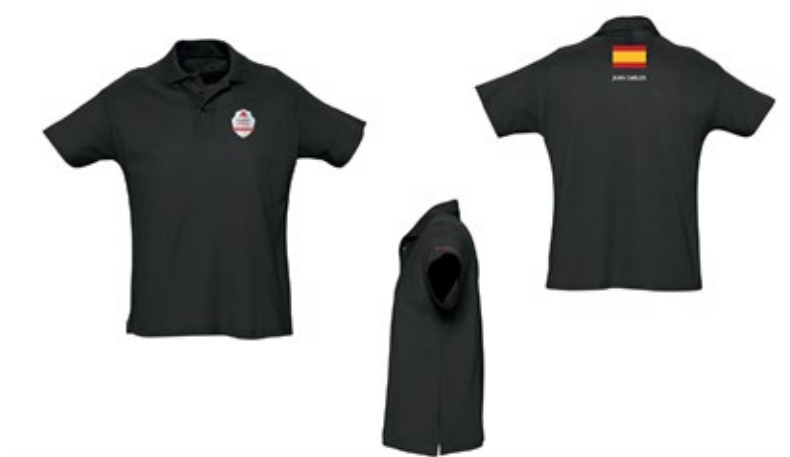
Figura 27. Polo técnico