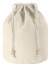
Figura 8: Necesar