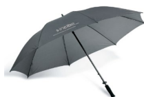
Figura 3: Paraguas bastón