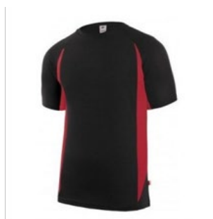
Figura 25: Camiseta técnica