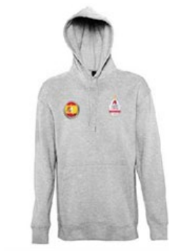
Figura 23: Sudadera

frecuente. Personalizada con logos y/o imagen personalizada con varias estampaciones (pecho, espalda) en blanco o en color. Varias tallas, hombre y mujer.