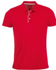
Figura 26: Polo