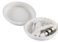
Figura 2: Auriculares