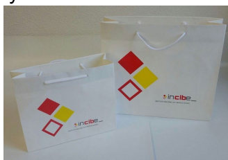
Figura 17. Bolsa de papel grande