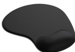
Figura 15. Alfombrilla ergonómica