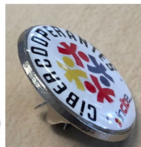
Figura 21. Pin metálico