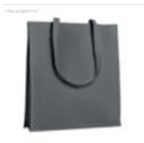
Figura 16. Bolsa