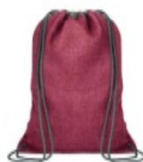
Figura 11: Mochila bolsa