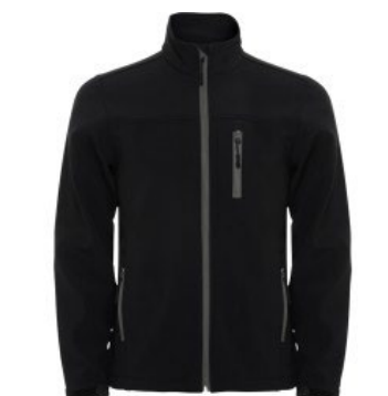
Figura 22: Chaleco/chaqueta