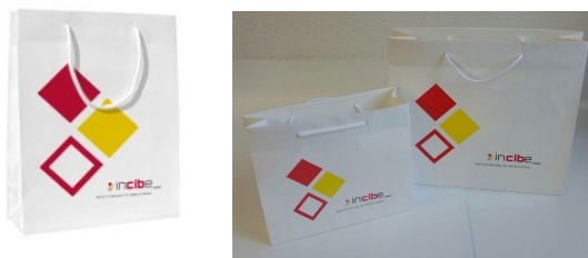
Figura 18. Bolsa de papel pequeña