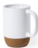
Figura 10: Taza