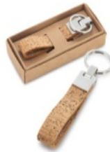
Figura 4: Llavero