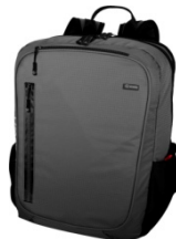
Figura 5: Mochila